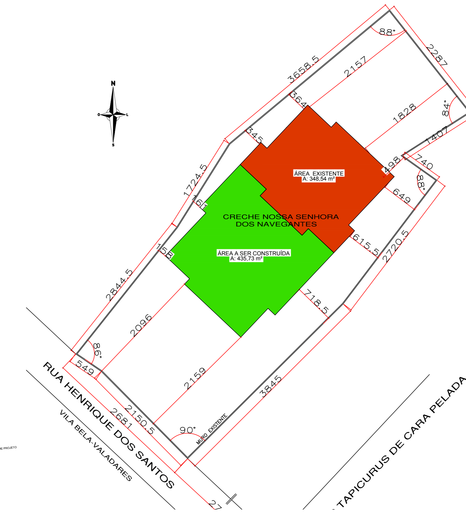
SITUAÇÃO ESCALA 1/350