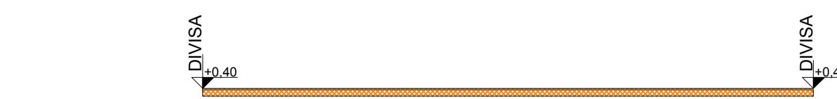
PERFIL TRANSVERSAL ESCALA - 1:200