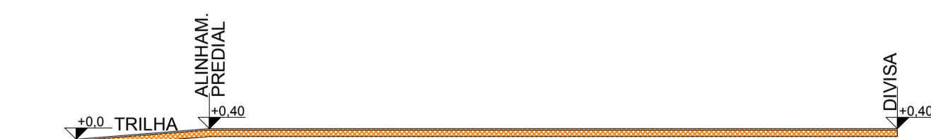
PERFIL LONGITUDINAL ESCALA - 1:200