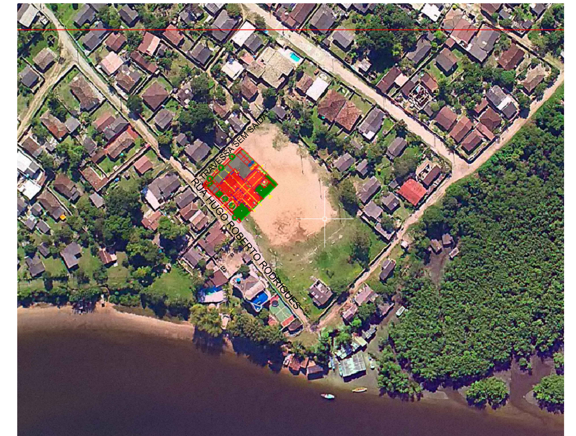
LOCALIZAÇÃO - VILA BELA - ILHA DOS VALADARES SITUAÇÃO SEM ESCALA