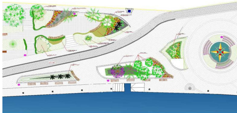
Figura 03 Maior integração aos ambientes da praça e criação de novos elementos/espços