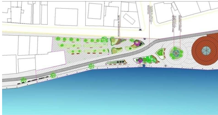
Figura 02 Maior integração aos ambientes da praça e criação de novos elementos/espços.